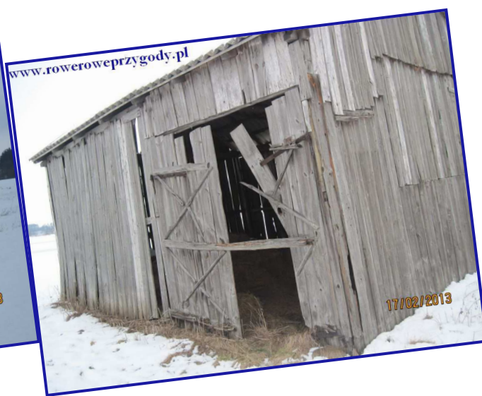
Zdjęcie nr 4- Z zewnątrz nic ciekawego, ale w środku cisza i spokój.

Niestety po „odwiedzeniu” stodołek jesteśmy ponownie zmuszeni wrócić na wał, gdyż na naszej drodze stają znowu wszędobylskie rozlewiska. Idąc wałem można zauważyć po prawej stronie, bliżej rzeki pojawiający się w oddali las. Mijamy charakterystyczną, pomalowaną na niebiesko śluzę. Minawszy ją, możemy zejść na dół i udać się w kierunku widocznego w pobliżu rzeki lasu. Brzegiem lasu dochodzimy prawie do samego Bugu, by potem kierując się wzdłuż niego obserwować las o charakterze grądu , o którym wspomniałem poniżej w kilku zdaniach ( patrz zdjęcie nr 5 ).