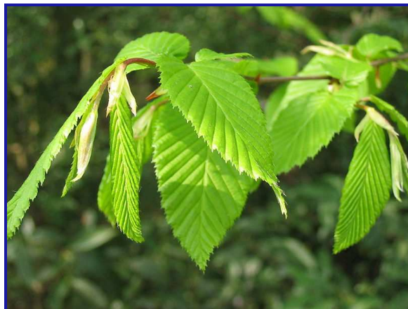
Zdjęcie nr 7- Liście grabu pospolitego.