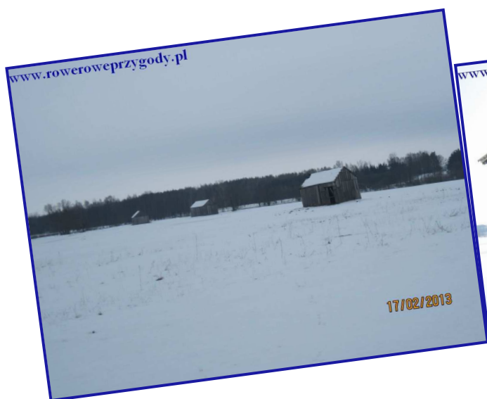
Zdjęcie nr 3- Coraz rzadszy widok na łąkach.

okazję podziwiać widok rozległych łąk i pól a także znaczne rozlewiska nadbużańskie. Dalej nasza wędrówka przebiega wałem, mijamy drogę przecinającą wał, w tle po prawej stronie małe, pojedyncze stodołki ( patrz zdjęcie nr 3 ). Jako atrakcję można potraktować zajrzenie do środka do którejś z nich, nigdy nie wiadomo, co zastaniemy we wnętrzu. Oczywiście dodam, iż stodołki są dobrym miejscem (chronią przed wiatrem), żeby zrobić sobie krótki odpoczynek i przy okazji coś przekąsić. My wybraliśmy drugą stodołkę, gdyż miała jak widać częściowo otwarte drzwi ( patrz zdjęcie nr 4 ). Jednakże trzeba mieć świadomość, że wchodzi się wyłącznie na własne ryzyko i odpowiedzialność. Są to bądź co bądź prywatne obiekty, zresztą w nienajlepszym już stanie. Pierwsza stodołka zresztą już na tyle była zniszczona, że w przyszłym roku pewnie zostaną z niej tylko wspomnienia.