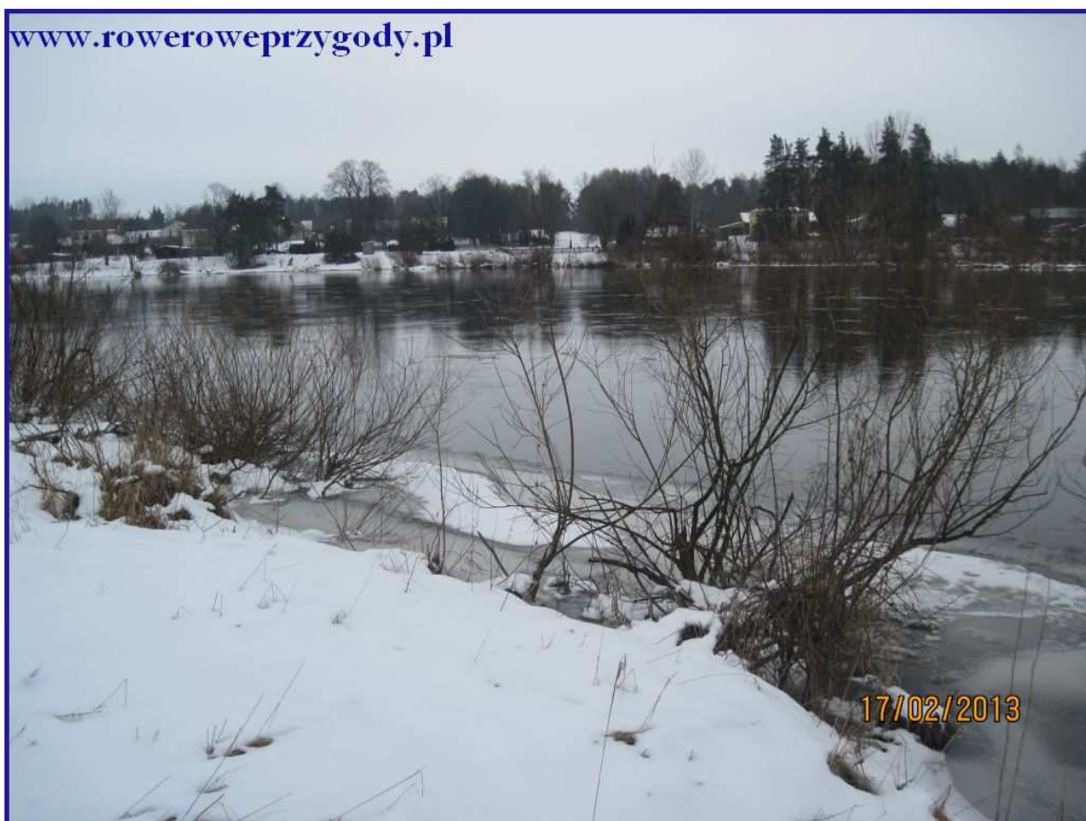
Zdjęcie nr 1 - Rzeka Bug w całej swojej okazałości.

Wycieczkę rozpoczynamy od punktu ekologicznego w Kiełpińcu, znajdującego się na skraju wsi od strony rzeki Bug. Najlepiej po wjeździe do Kiełpińca od strony Sterdyni, jechać prosto, nigdzie nie skręcając. Jest to miejsce dogodne dla turysty zmotoryzowanego, gdyż oprócz altany, w której możemy się posilić jest także miejsce, gdzie możemy bez problemu zaparkować samochód. Po zaparkowaniu samochodu, kierujemy się w lewo, mijamy kilka zabudowań łącznie z urokliwym domkiem nazwanym „Kempówka”, by chwilę potem skręcić w prawo w dosyć szeroką piaszczystą drogę (oczywiście zimą tego piachu pewnie nie będzie widać), która zaprowadzi nas wprost do wału przeciwpowodziowego. Dla wygody, w dalszej części opisu będę używał słowa „wał”. Droga wygodna, po około kilkuset metrach przechodzimy przez wał, po czym kierujemy się dalej prosto, by po przejściu ok. 1000 metrów dojść do rzeki Bug ( patrz zdjęcie nr 1 ). Tutaj kierujemy się w dół rzeki, tj. w lewą stronę (podaję na wszelki wypadek kierunek, gdyby nie było widać nurtu).