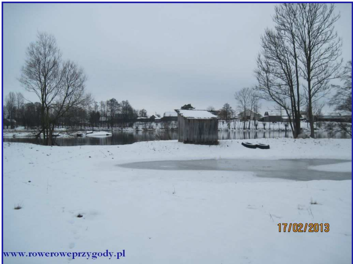
Zdjęcie nr 8- W oddali mała stodołka, którą miniliśmy po prawej stronie.

Dalsza wędrówka jest bardzo wygodna, idziemy bezpośrednio przy Bugu. Zmienia się też charakter rzeki. Rzeka wylewa się teraz bardzo szeroko.