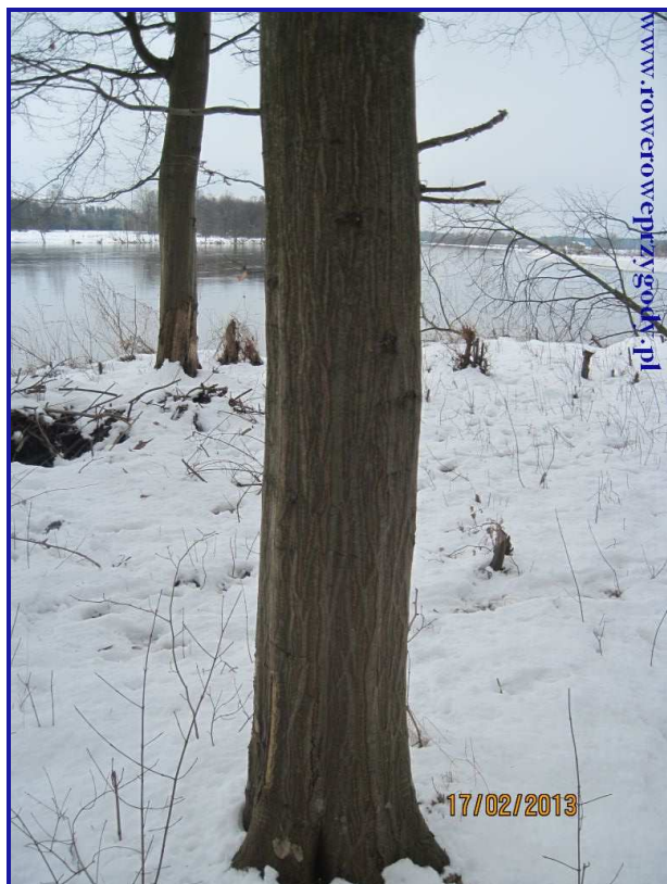
Zdjęcie nr 6- Charakterystyczny pień grabu pospolitego.