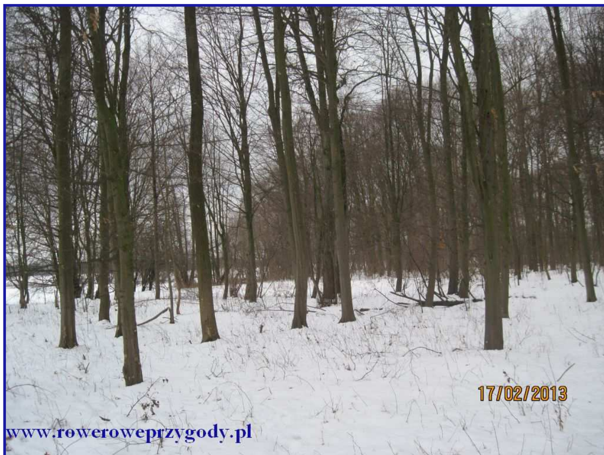
Zdjęcie nr 5- Na pierwszym planie widoczne graby.

Grąd - wielogatunkowy i wielowarstwowy las liściasty, typowy dla obszarów nizinnych i podgórszych, rosnący na siedliskach żyznych. W drzewostanie dominują dęby i graby z domieszką klonu, lipy, brzozy, osiki, jaworu, wiązu i jesionu. Ciekawostką jest to, że las o charakterze grądu wytwarza więcej ściółki niż pozostałe typy lasów, co wpływa na lepszą żyzność gleby. Dlatego też, lasy te były najczęściej wycinane pod pola uprawne. Jak wyczytałem w Wikipedii, tam gdzie teraz kiedyś znajdowały się grądy, teraz znajdują się pola uprawne. Zachowały się jedynie w miejscach, gdzie są trudności w przeprowadzaniu upraw.